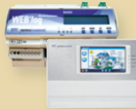
Meteocontrol WEB'log und Meteocontrol WEB'log Comfort Datenlogger