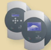
Solar-Log 500/1000™ Datenlogger