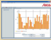
StecaGrid User Visualisierungssoftware