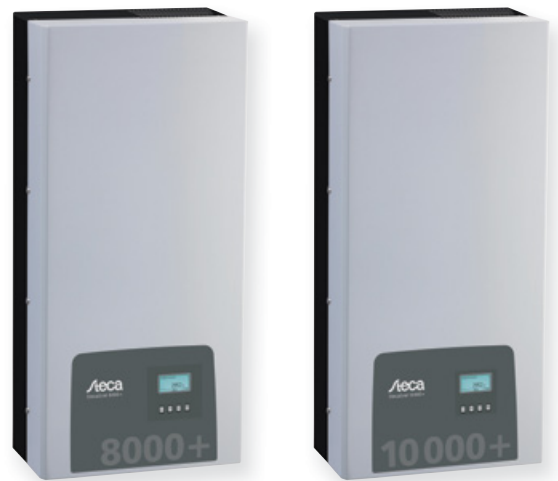
StecaGrid 8000+ 3ph