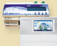
Meteococontrol WEB'log und Meteococontrol WEB'log Comfort Datenlogger