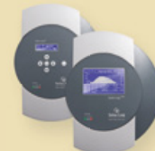
Solar-Log 500/1000™ Datenlogger